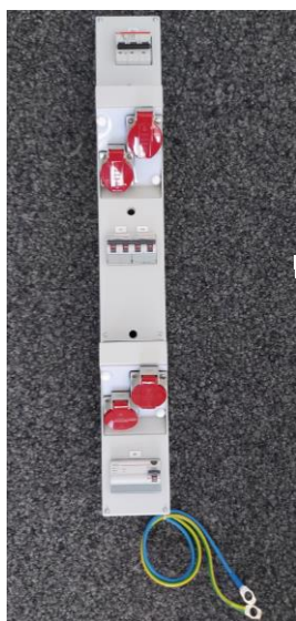
4x T25 16A - 5-polig