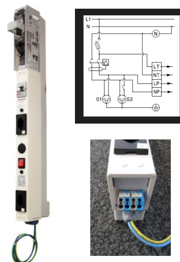
2x T13 16A, 3-polig

Für Fragen, Offerten oder Bestellungen stehen wir Ihnen selbstverständlich gerne zur Verfügung: