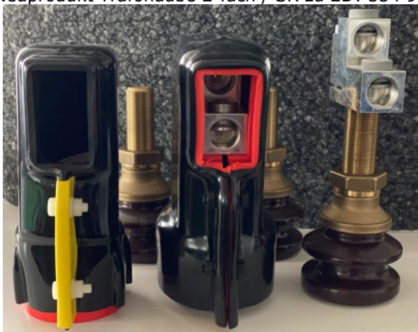
Mitte: Neuprodukt 334 999-630Var0313 (rot)

Neuprodukt Trafohaube 2-fach / SR zu 2D: 334 999-630Var0313