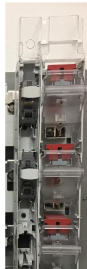
143 041-020 (EUROSWITCH)