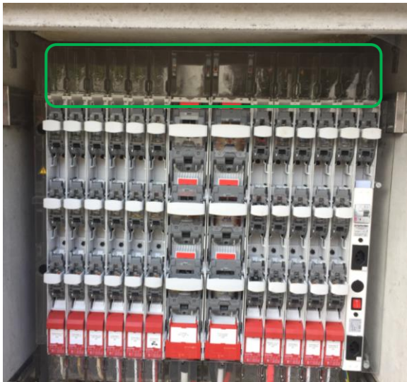
Art. Nr.: 143 041-005 (TRIVER+)